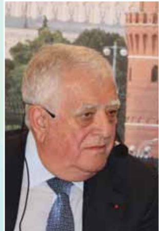
معالي الأستاذ عدنان الفصار، رئيس الاتحاد العام لغرف التجارة والصناعة والزراعة للبلاد العربية

إن التعاون بين روسيا والبلدان العربية من شأنه أن يتطور ليس فقط على المستوى الدولي بل وعلى مستوى البزنيس الخاص وعلى مستوى الأقاليم. ويؤدي كل الدورات الاقتصادية العالمية، التي تنتهي بالأزمة إلى دخول المستوى التكنولوجي الجديد. وينبغي أن يجري تعامل روسيا مع الدول العربية ليس فقط في مجال استخراج الخامات والوقود بل وفي مجال تطوير المشاريع الجديدة الخاصة بالتقنيات المتطورة والراقية.