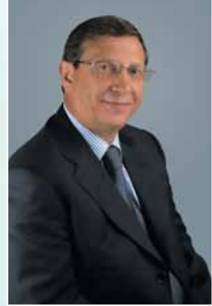
معالي الدكتور فلاديمير يفتوشينكوف، رئيس مجلس إدارة شركة «سيستيم» القابضة، رئيس مجلس الأعمال الروسي العربي

أنوه بارتياح بأن العلاقات التجارية الاقتصادية بين روسيا وبلدان المنطقة العربية في حالة الصعود. إن التبادل التجاري الدائم، وإجراء المقابلات والمبادرات، ومشاركة رجال الأعمال الروس والعرب في الفاعليات الثنائية ومتعددة الجوانب لجدول الأعمال، وافتتاح منليات الشركات الروسية في الخارج والشركات الأجنبية في روسيا، وتوقيع البيانات والمعاهدات وبداية تحقيق المشاريع المشتركة يدل كل هذا على اهتمام أوساط الأعمال الروسية الإقليمية بالعمل المشترك.