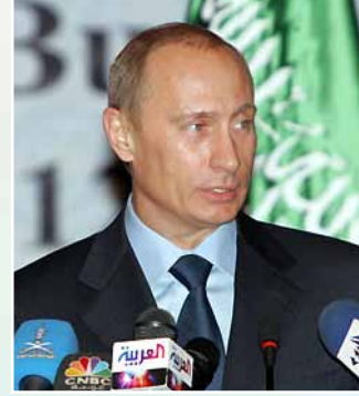
فخامة الرئيس فلاديمير بوتين رئيس روسيا الاتحادية

خلال فترة وجيزة نسبيا ساهم مجلس الأعمال الروسي العربي ومجالس الأعمال الثنائية العاملة تحت رعايته في تفعيل العلاقات الروسية العربية في المجالات التجارية والاقتصادية، والاستثمارية، والعلمية التقنية والانسانية. وتعزم روسيا على أن تستمر في توطيد علاقاتها مع العالم العربي بشكل نشيط ومنتظم من أجل ازدهار ورفاهية بلداننا وشعوبنا لصالح الاستقرار الإقليمي والعالمي.