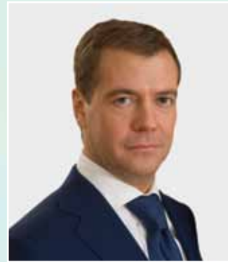
فخامة السيد دميتري ميدفيديف، رئيس حكومة روسيا الاتحادية

نرى مهمتنا الرئيسية في الرفع من مستوى علاقات روسيا مع البلدان العربية وإعطاء ديناميكية إضافية للتعامل الاقتصادي. وأنا متأكد من أن المعرض «أرابيا إيكسبو» والمناقشات في مجلس الأعمال الروسي العربي سوف تساعد على توسيع الاتصالات المفيدة بين أوساط الأعمال، ورجال الأعمال والمنظمات، والبنزيس المتوسط والصغير، والتوصل إلى اتفاقات الأعمال الجديدة والاتفاقيات المتبادلة المنفعة.